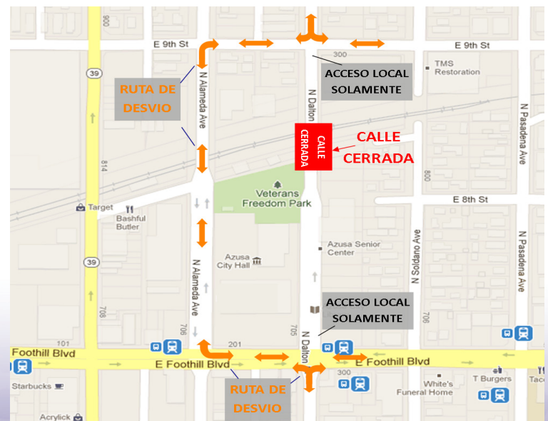
Representación del mapa de desvío para el cierre de la Avenida Dalton en Azusa, CA.