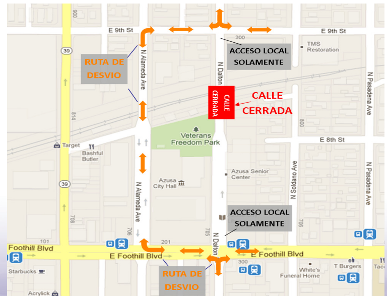
Representación del mapa de desvío para el cierre de la Avenida Dalton en Azusa, CA.