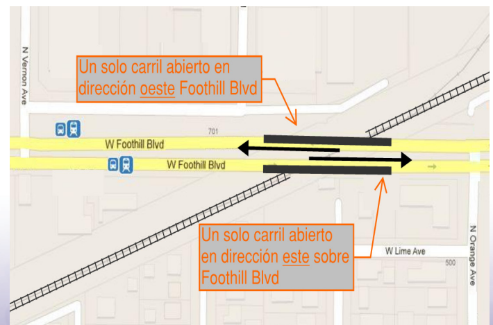
Representación de cierres de carriles a lo largo del bulevar Foothill en Azusa.

Sylvia Beltran, Relaciones Comunitarias Autoridad Constructora Metro Gold Line Extensión Foothill (626) 305-7012 / sbeltran@foothillextension.org